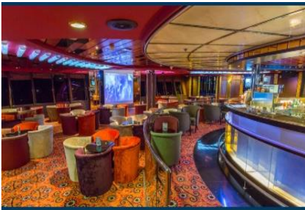
Karaoke Lounge / KTV