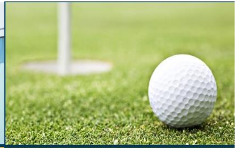
Golf Driving Range